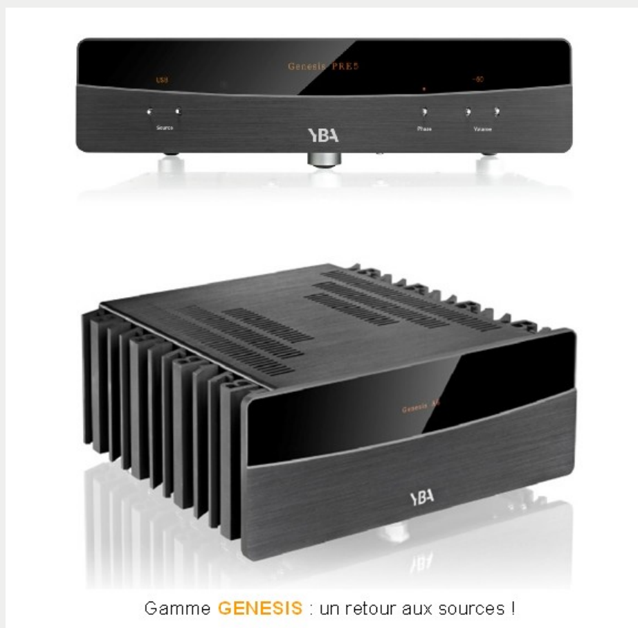
Gamme GENESIS : un retour aux sources !

Pour accompagner le redéploiement de sa marque, YBA a tenu à marquer l'évènement en proposant une toute nouvelle gamme de produits : elle répond au joli nom de GENESIS et comprend un amplificateur intégré IA 3 et l'ensemble PRE 5 et A 6 qui font l'objet du présent banc d'essai. Avec ce